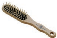
Holzbürste · Art.-Nr. 106200 Ideal für leichtes Durchbürsten